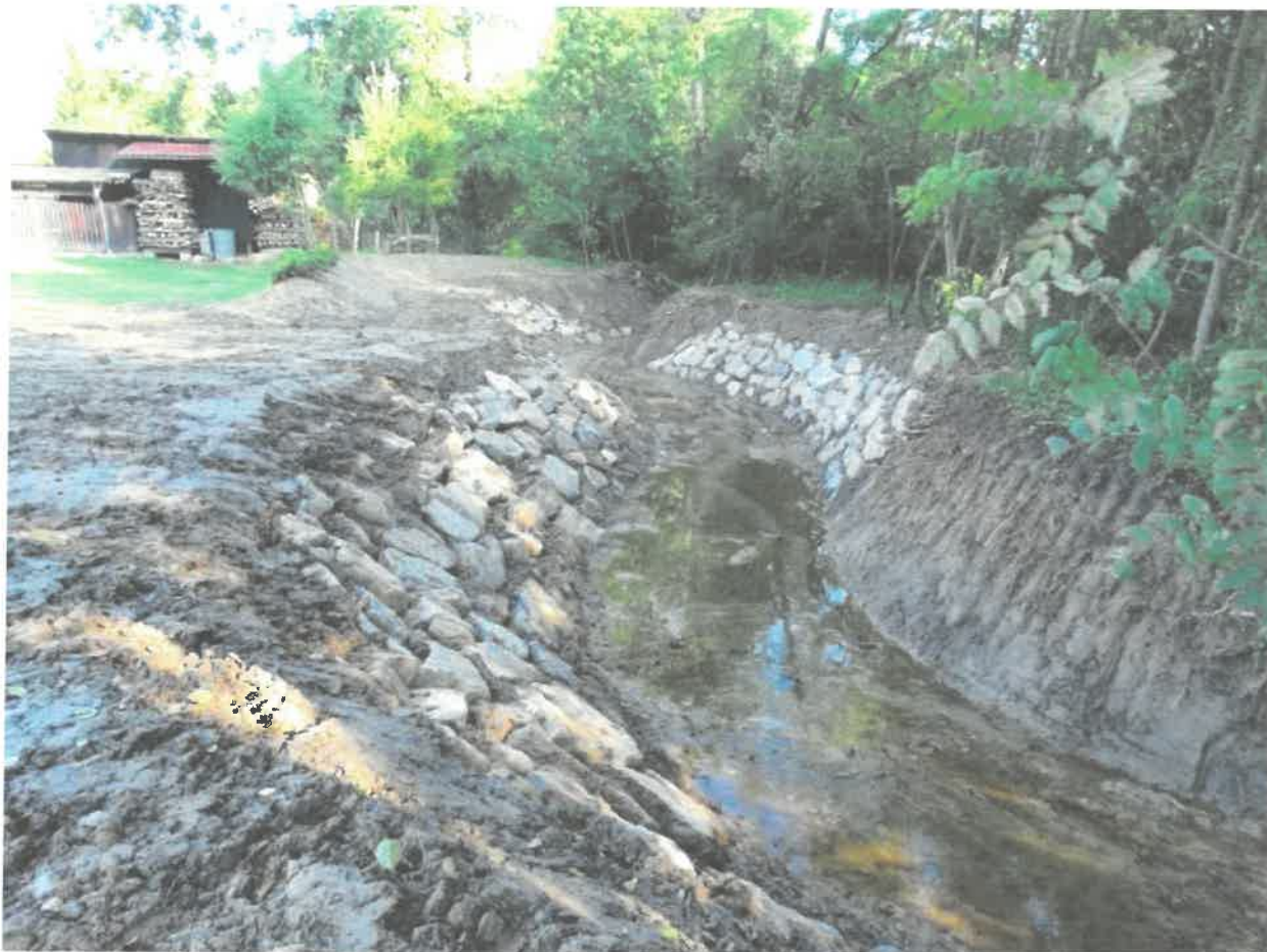
Fotografia nr 16 - Awaryjne udroźnienie zatkanego przepustu na potoku Więćkówka