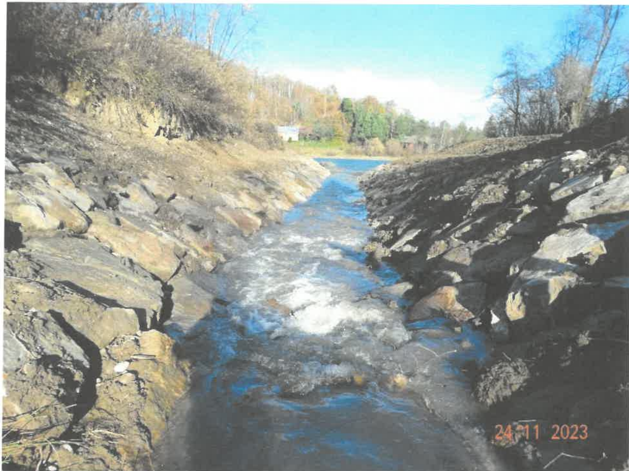
Fotografia nr 10 - Potok Wolanka w km 0+000 – 4+400