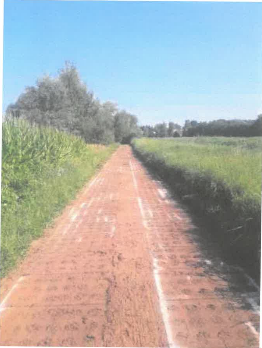
Fotografia nr 6 - Oczyszczenie drogi przywałowej potoku Milówka w km 0+000 – 2+180