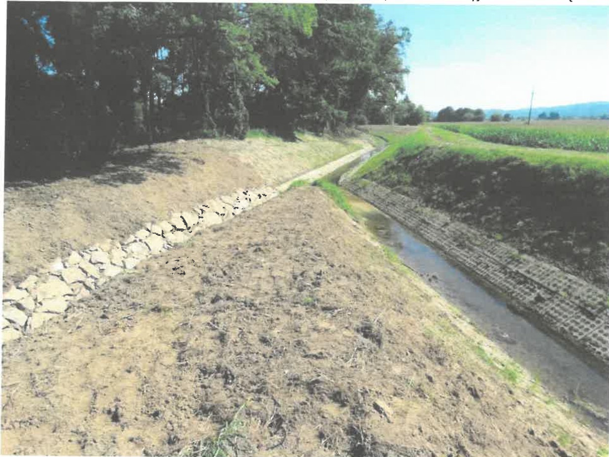
Fotografia nr 8 - Likwidacja nor bobrowych oraz zabezpieczenie przed destrukcyjną działalnością bobrów