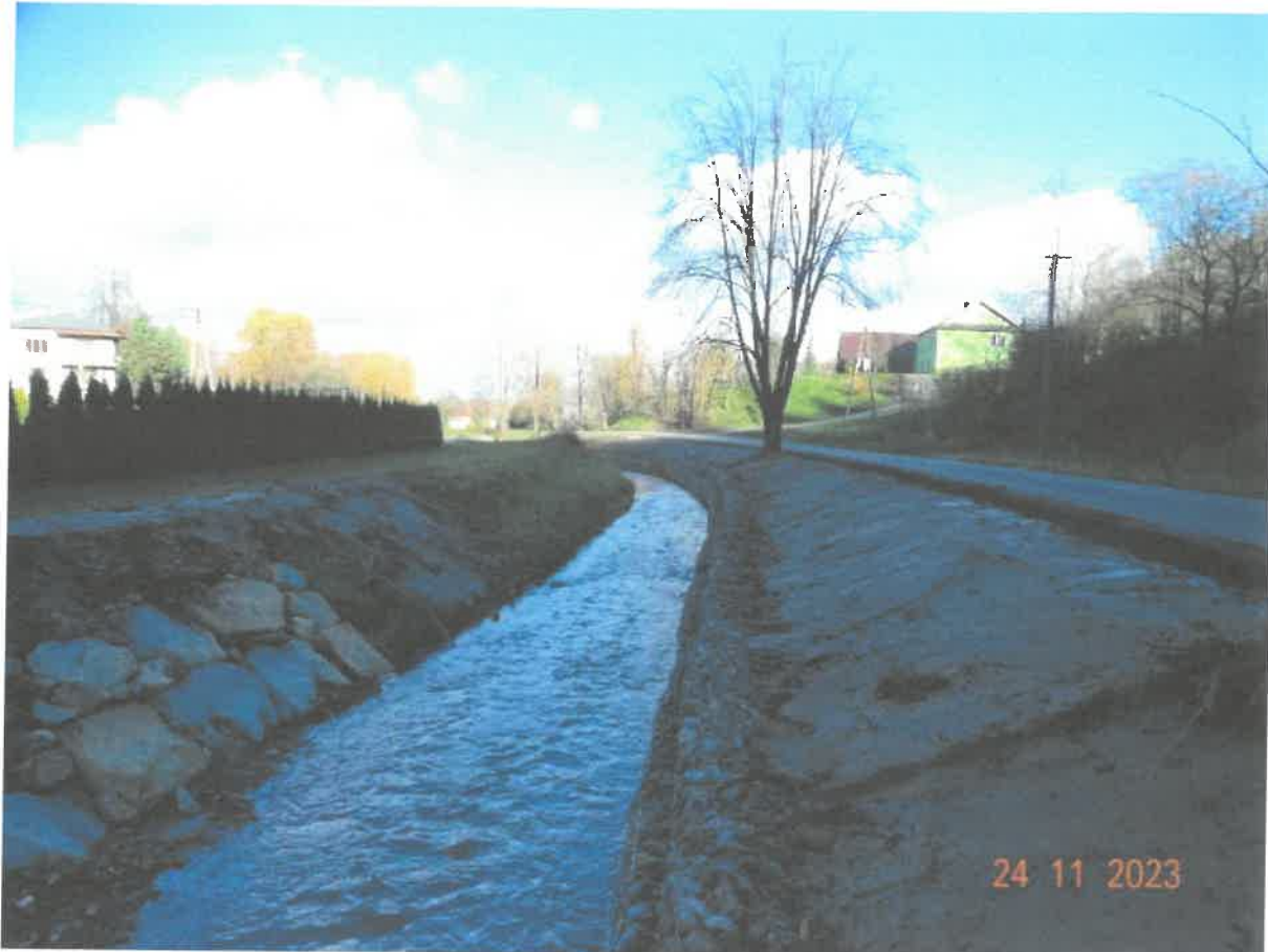
Fotografia nr 4 - Potok Rudzanka w km 0+000 – 6+390