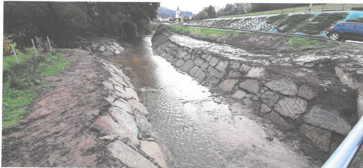
Fotografia nr 2 - Potok Paleśnianka i Olszowianka