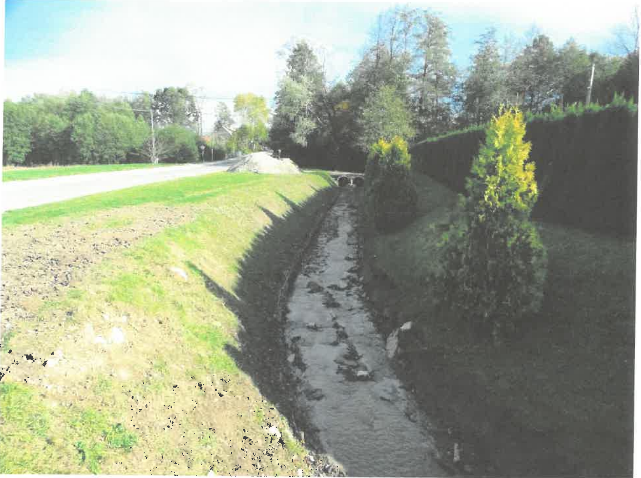
Fotografia nr 12 - Potok Wolanka w km 0+000 – 4+400