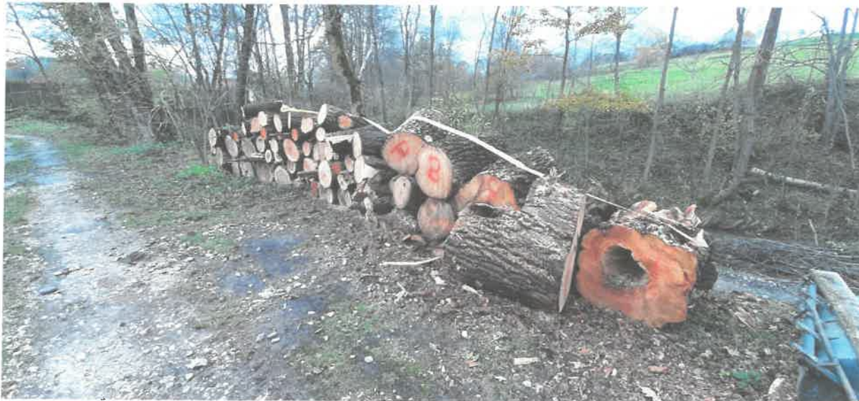
Fotografia nr 18 – Konserwacja i utrzymanie obwałowań