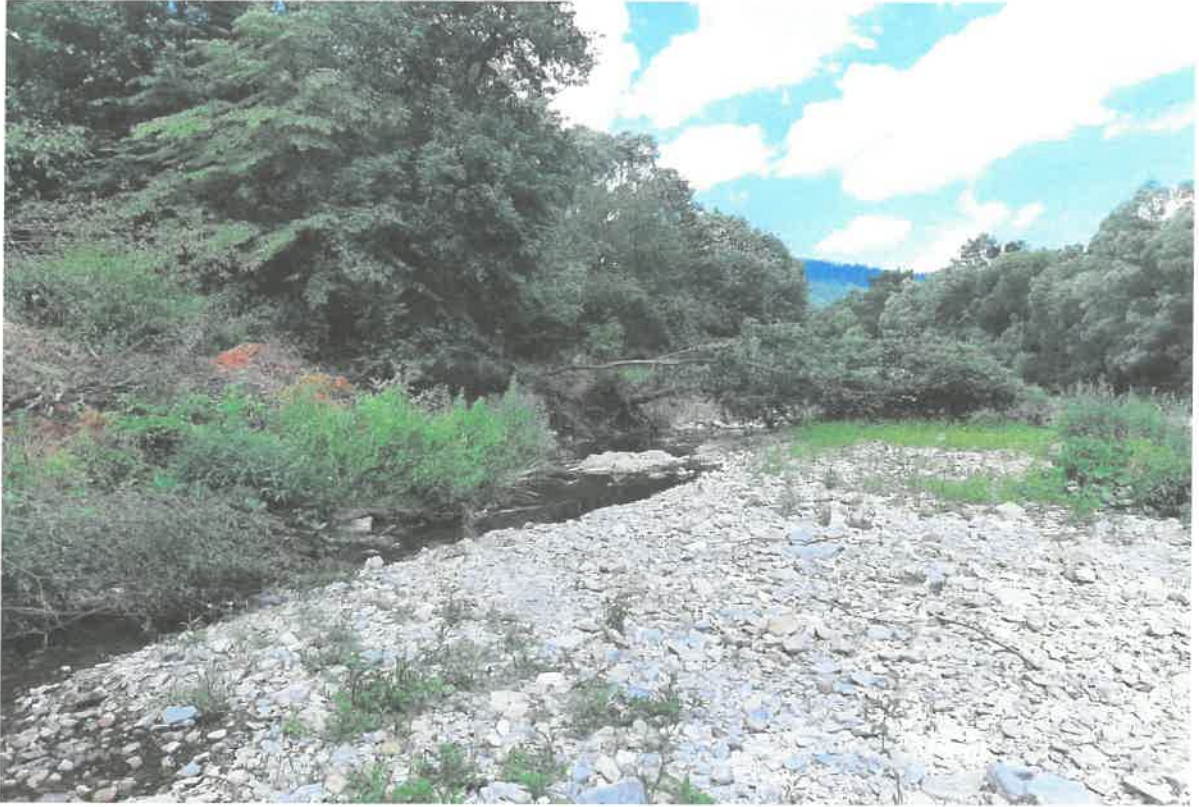
Zdjęcie nr 3: pot. Słopniczanka w km 0+800-1+100 w m. Tymbark (przed pracami)