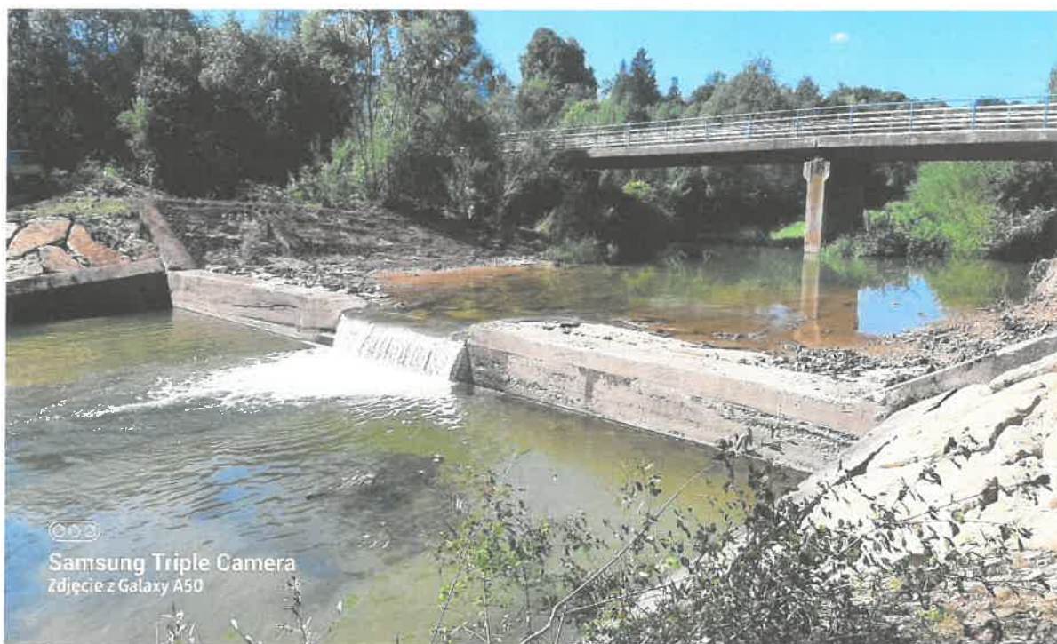
Zdjęcie nr 2: rzeka Łososina stopień betonowy w km 42+420 w m. Podłopień (po pracach)