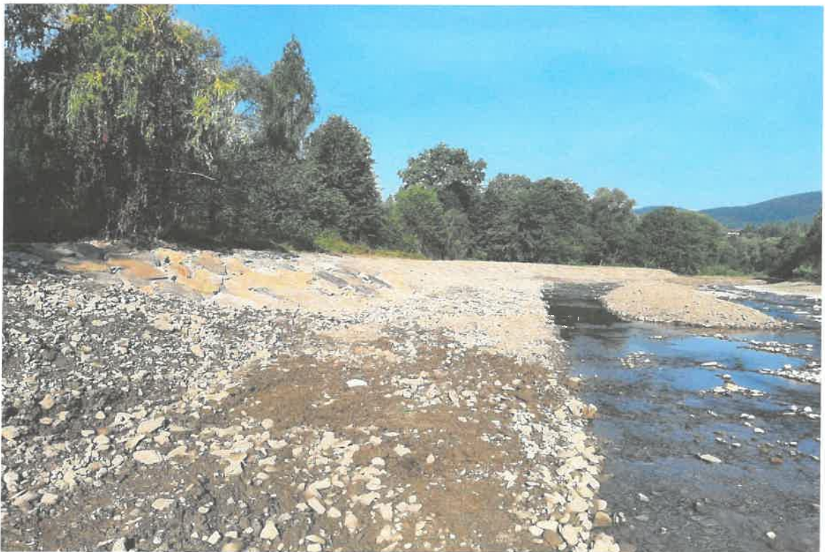
Zdjęcie nr 4: pot. Słopniczanka w km 0+800-1+100 w m. Tymbark (po pracach)