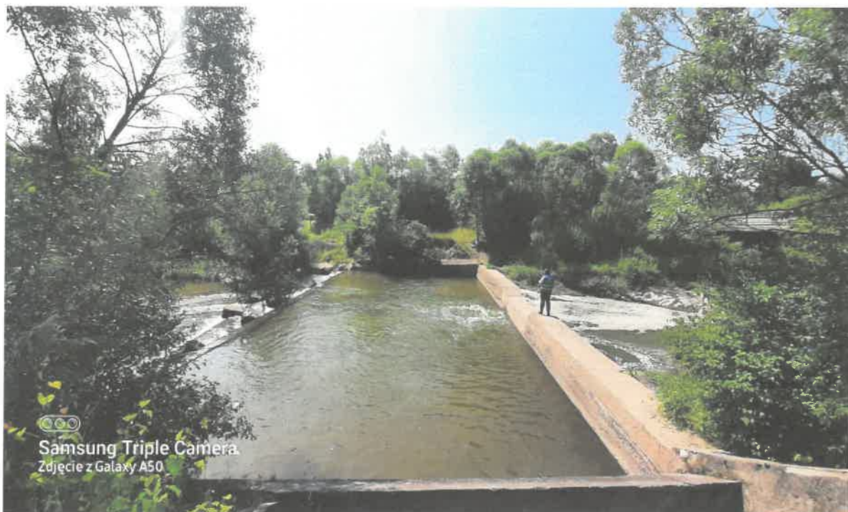
Zdjęcie nr 1: rzeka Łososina stopień betonowy w km 42+420 w m. Podłopień (przed pracami)