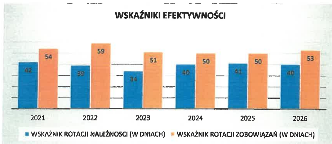
Wykres nr 3 Wskaźniki efektywności w latach 2021-2026

Źródło: opracowanie własne na podstawie Sprawozdań finansowych SP ZOZ w Brzesku za lata 2021-2023.