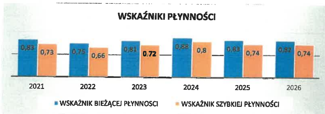
Wykres nr 2 Wskaźniki płynności w latach 2021-2026

Źródło: opracowanie własne na podstawie Sprawozdań finansowych SP ZOZ w Brzesku za lata 2021-2023.