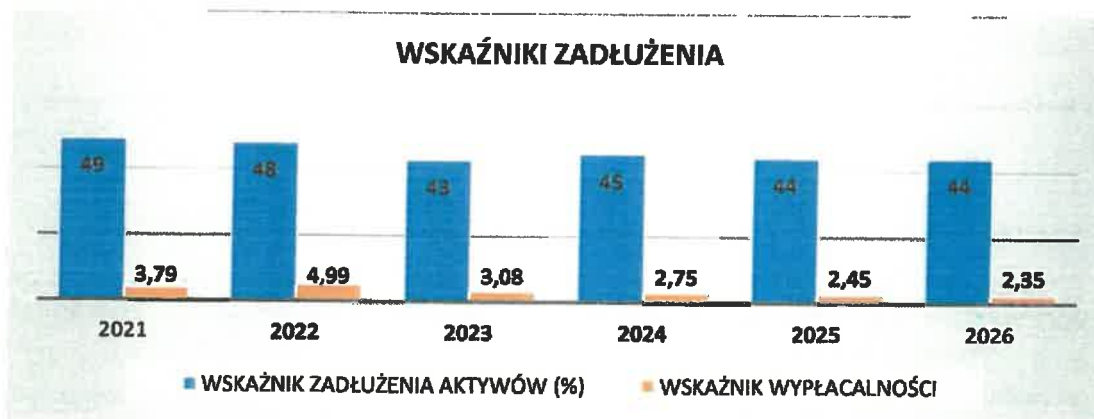
Wykres nr 4 Wskaźniki zadłużenia w latach 2021-2026

Źródło: opracowanie własne na podstawie Sprawozdań finansowych SP ZOZ w Brzesku za lata 2021-2023.