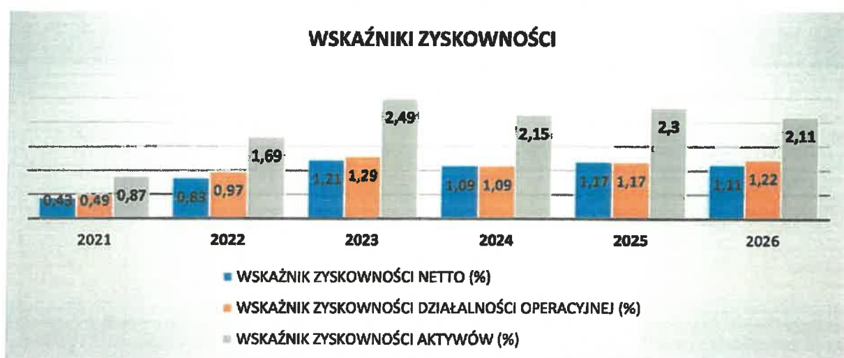
Wykres nr 1 Wskaźniki zyskowności w latach 2021-2026

Źródło: opracowanie własne na podstawie Sprawozdań finansowych SP ZOZ w Brzesku za lata 2021-2023.